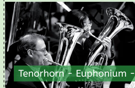
Tenorhorn - Euphonium - Bariton